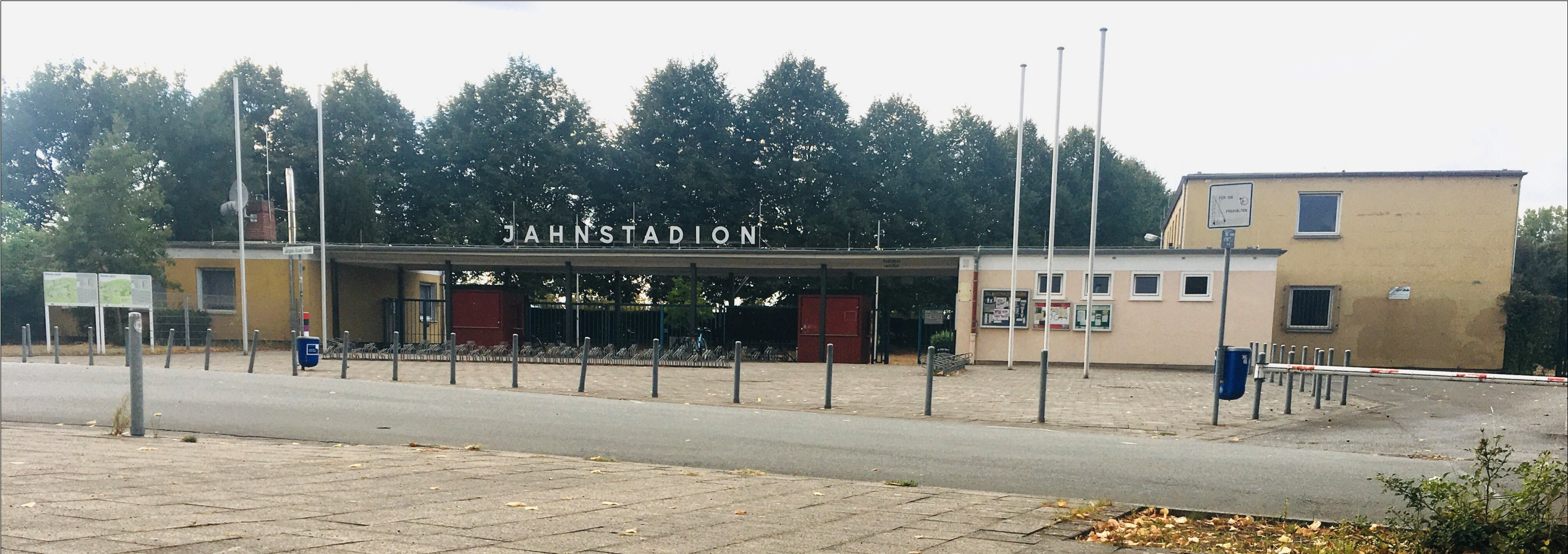
Eingangsanlage Jahnstadion / Sportzentrum Ost